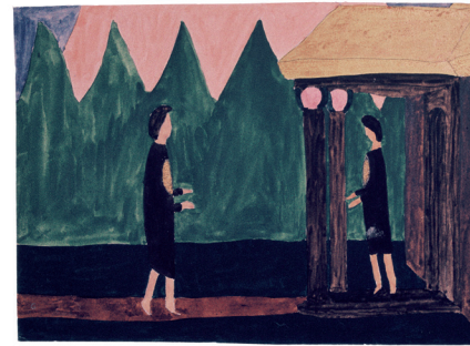
Goesch. „Buddhistische Mönche“

Restaurant „Zunft zu Webern“, Gerechtigkeitsgasse 68, Bern